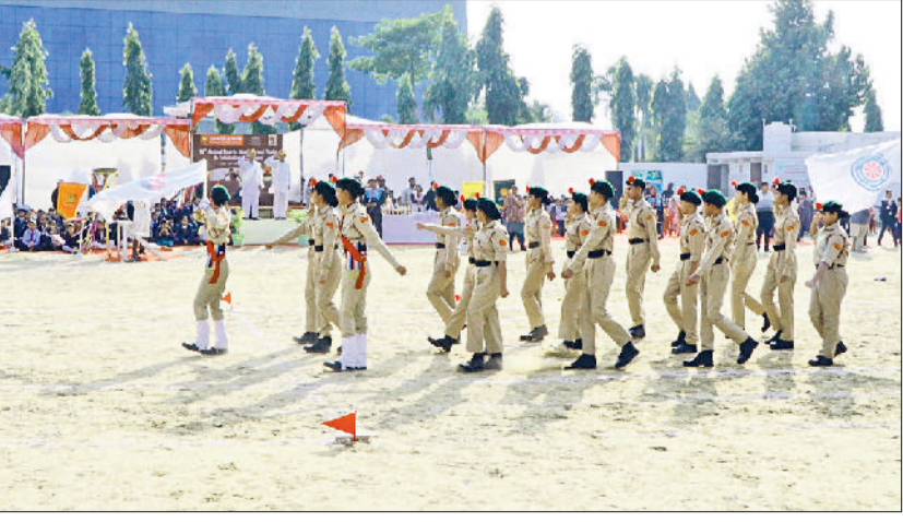
झज्जर। मार्च पास्ट कर मुख्यातिथि को सलामी देते हुए विद्यार्थी।