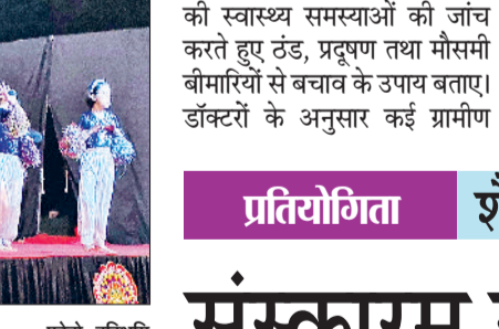
बहादुरगढ़। नृत्य की प्रस्तुति देते विद्यार्थी।