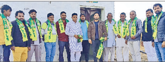
झज्जर। दौरे के दौरान ग्रामीणों को स्थापना दिवस समारोह में पहुंचने का निमंत्रण देते हुए जेजेपी कार्यकर्ता।