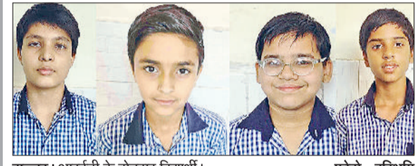
झज्जर। आरईडी के होनहार विद्यार्थी।