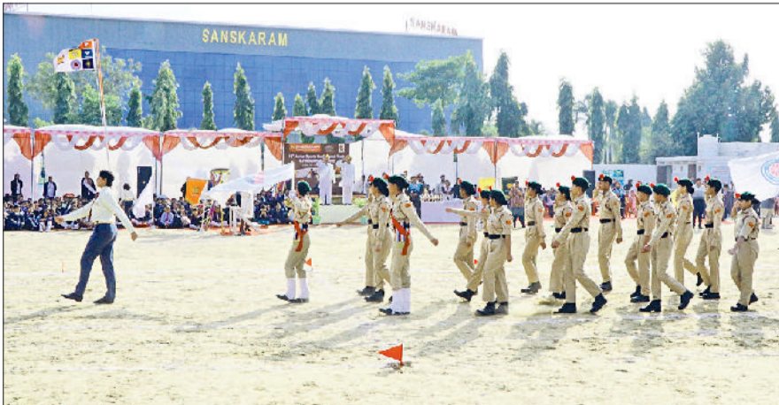
झज्जर। मार्च पास्ट कर मुख्यातिथि को सलामी देते हुए विद्यार्थी।

संस्कारम पब्लिक स्कूल खातीवास में रविवार को 10वीं वार्षिक खेल समारोह का ग्रैंड फिनाले और भव्य पुरस्कार वितरण समारोह का आयोजन किया गया। समारोह का मुख्य आकर्षण परेड्ट्स, ग्रैंडपेरेड्ट्स और टीचर्स के लिए आयोजित विशेष स्पोर्ट्स मीट रही, जिसने सामुदायिक सामंजस्य का अद्भुत