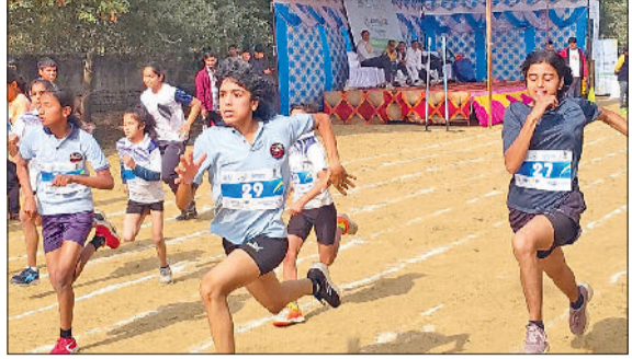
बहादुरगढ़। जीत के लिए दौड़ लगाती लड़कियां।