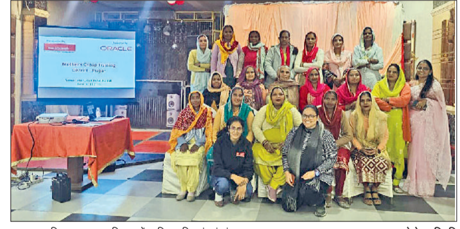
झज्जर। अभिभावक समूह प्रशिक्षण में शामिल महिलाएं एवं संस्था सदस्य।

ब्रेकथ्रू संस्था द्वारा शहर के एक निजी होटल में तीन दिवसीय अभिभावक समूह प्रशिक्षण का आयोजन किया गया। प्रशिक्षण में शामिल 25 गांवों के अभिभावकों के साथ जेंडर के प्रति संवेदनशीलता विकसित की गई। इस दौरान पाँच प्रेजेंटेशन के माध्यम से लिंग भेद समझते हुए प्रशिक्षकों ने बताया कि जेंडर के आधार पर भेदभाव जन्म से ही शुरू कर दिया जाता है। पंकी पीछे रह जाती है और पंजज आगे बढ़ जाता है। क्योंकि पंकी को पंजज की अपेक्षा कम मौके मिलते हैं। उन्होंने