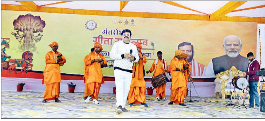
झज्जर। कार्यक्रम के दौरान अपनी प्रस्तुति देते हुए कलाकार।