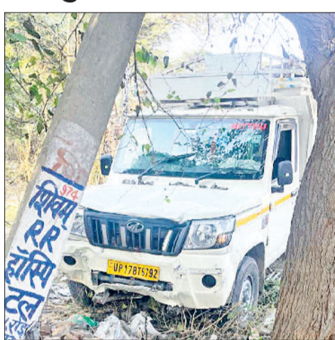
बहादुरगढ़। इस गाड़ी से हुआ हादसा।