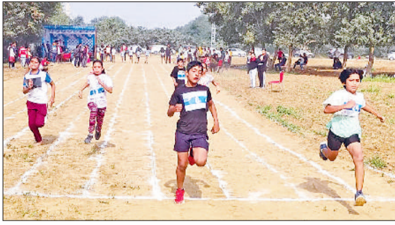
बहादुरगढ़। जीत के लिए दौड़ लगाती लड़कियां।